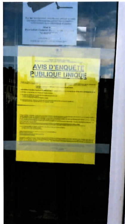
Affichage dans le Hall d'entrée de la Mairie