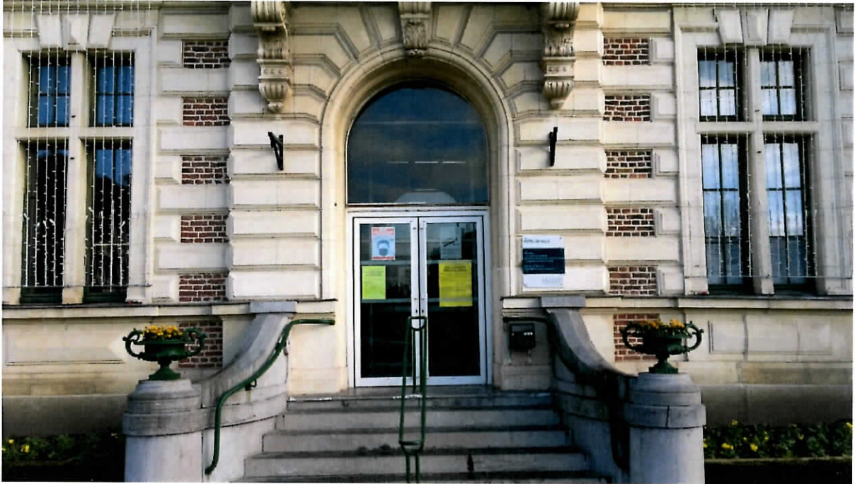
Affichage sur la porte d'entrée de la Mairie